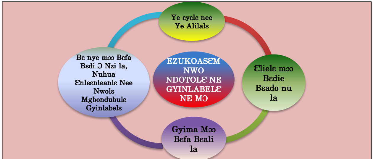
Nvoninli 1: Ezukoasẹm nwo Ndotolẹ Ginyinlabelẹ Ngakyile ne mọ

nwo Edwẹkẹ Ẹvọlẹ ne ara awieleẹ. Gya Sonvọlẹ ne ginyinla Maanle Kpanyinli ne agyakẹ anu na ọfa Ezukoasẹm nwo Ndotolẹ ne mọ ọto gua. Ezukoasẹm nwo Ndotolẹ ne kọ ginyinlabelẹ titili nna (4) anu. Bẹmẹ a le ye Ẹyẹlẹ, Ẹlielẹ mọọ bẹdiẹ bẹto nu la, Gyima mọọ bẹfa bẹyẹ la nee bẹ Nye mọọ bẹfa bẹdi ọ nzi la nee nwọlẹ mgbondubulẹ nee nuhua Ẹnleeanleankẹ. Yemọ a bẹhye nwọlẹ nvoninli wọ nvoninli ko ne anu wọ ọ bo ẹke la: